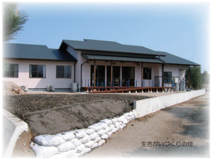
生きがいつくりの畑