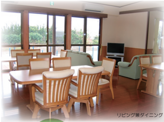
リビング兼ダイニング

小規模多機能型居宅介護は、日帰りの通いサービスを中心に訪問サービス、宿泊サービスを組み合わせ 24 時間、365 日利用者様の在宅生活を支援する介護サービスです。利用者様が住み慣れた地域で安心した生活を送れるよう支援いたします。