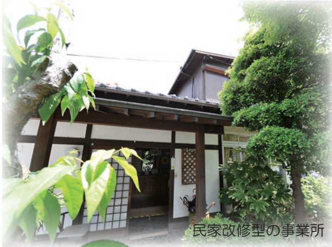
民家改修型の事業所

小規模多機能型居宅介護は、日帰りの通いサービスを中心に訪問サービス、宿泊サービスを組み合わせ 24 時間、365 日利用者様の在宅生活を支援する介護サービスです。利用者様が住み慣れた地域で安心した生活を送れるよう支援いたします。