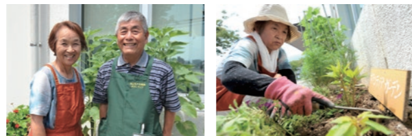
お2人がそれぞれの特技を活かして院内に花を届けている。手入れして花が絶えない、玄関横の「ボランティアガーデン」。

「患者さまを癒したい」というボランティア精神が、生け花と共に院内にあふれている。