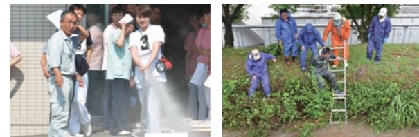
防災訓練での職員への消火栓操作指導。