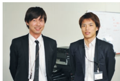
若い2人が、電子カルテ等のシステム全般を支えている。

電子カルテやプリンターが使えないということは、診察がほぼストップしてしまうことを意味する。彼らは日頃から院内に数百台あるパソコンやプリンター、コンピューターサーバーの管理を入念に行い、ひとたび異常が発生すればすぐさま現場に駆けつける。