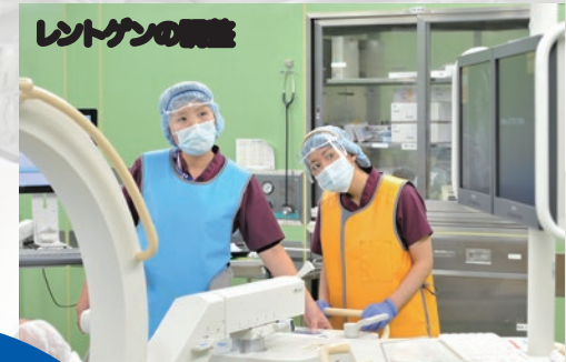
レントゲンの調整

移動式レントゲン撮影装置を、医師の指示に合わせて微調整して術部をモニターに映し出します。