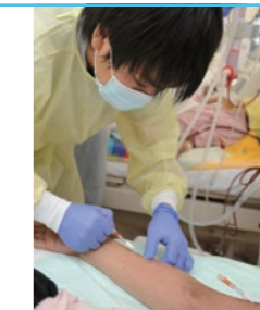
針を刺して血液の通り道を確保することも行うので、機械だけでなく、医療の知識も多く求められます。

患者さまの状態に異常がないかを問診、観察して確認した後、血管に針を刺して人工透析装置と繋がります。