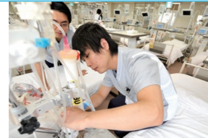
血液透析の機械は、一度の治療で3~5時間と長時間連続稼働するので、事前の点検・整備には細心の注意を払います。