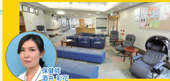
保健師 酒井 彩花