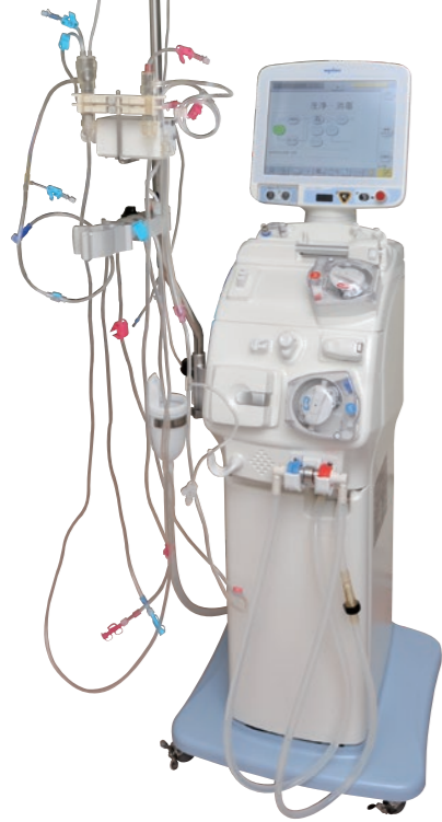
透析センターで主に使用されている人工透析器。腎臓を患った患者さまの血液の浄化を行います。

病院の中でも、たくさんの機械を長時間、連続して使用する『透析センター』は臨床工学技士が多く関わる現場の1つです。