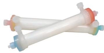
ダイアライザー 血液のろ過装置で人工透析機の重要な役割を担う部品です。

「血液透析」は、血液を一旦体外に取り出し、ダイアライザーという透析器に通すことで血液を浄化します。また、1度の治療は3~5時間と長時間を要し、それを週に2~3回行わないといけないので、患者さまにとって透析機は正に「長く付き合う機械」となるのです。