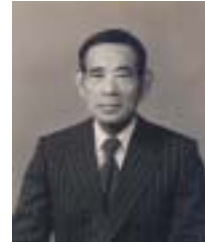
主丸町に鬼塚内科医業して院を開業して

いました。不治の病に対処するため、私財を投げうって現在地に療養所を開設したので。