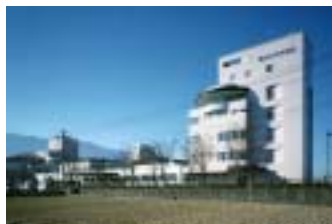
田主丸中央病院の施設拡充は平成十三年に一段落、現在の外観が整いました。

平成元年から、地域の皆様への感謝の念をあらわすため、「ふれあいチャリティコンサート」を毎年開催しています。