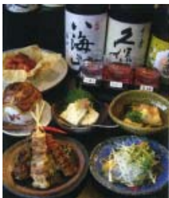
「おまかせコース」と「飲み比べセット」

す。浮羽町の自宅の目前にパイパスが通ることが決まったのをきっかけに、ご自分で居酒屋を開こうと自宅の庭に建てたのが「賀茂庵」です。店名は、子供の頃よく遊んだ賀茂神社に由来するそうで、地域の人たちにも親しんでもらおうという思いが込められています。当時、周辺にはご婦人達が会合などの帰りに料理もお酒も楽しめるお店が少なかったことから、落ち着いた雰囲気での料理をいただけるお店づくりを心がけたそうです。そのせいか、最初は女性客が多かったといえます。