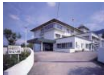
昭和五十四年に社会福祉法人ひじり会を設立、翌年に建