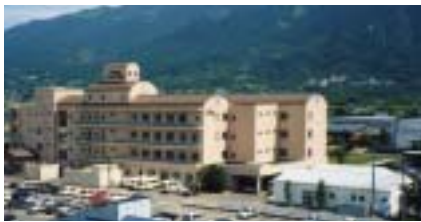
の写真左が老人保健施設サンライフ聖峰、右が健康科学センター・サンヘルス聖峰です。

が園長を勤めています。平成に入り、当法人は時代の要請に呼応し順次、施設を拡充していきます。上