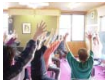
当院の介護予防教室 市町村が行なう介護教室、家族の会などへの参加を是非お勧めします。

A 介護方法は内容によって方法が各種ありますが、ここでは介護に対する心構え、知っておくと得ることをご紹介いたします。また、介護施設や医療機関、