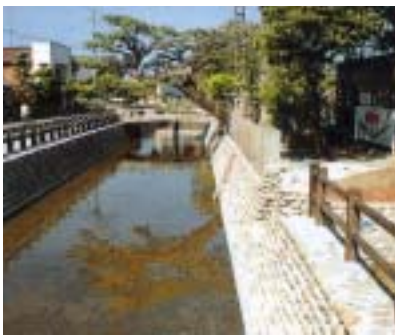
吉井幼稚園前の護岸工事

道路や橋梁などの一般土木工事だけでなく、特殊な土木工事にも積極的に取り組んでいます。小口径推進工法（地表面から立坑を掘