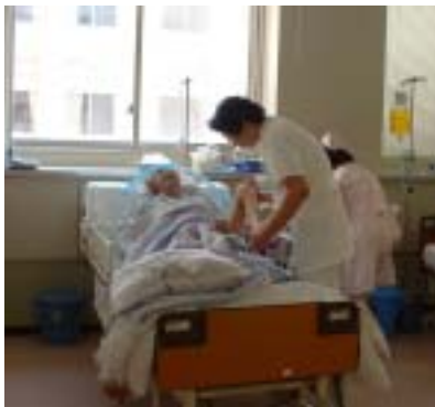
病棟での訓練風景