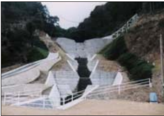
三日谷川砂防工事

防ダム工事のように、危険と背中合わせの現場が多いので、毎朝の朝礼時でも、徹底的に安全に心掛けるように注意しているそうです。