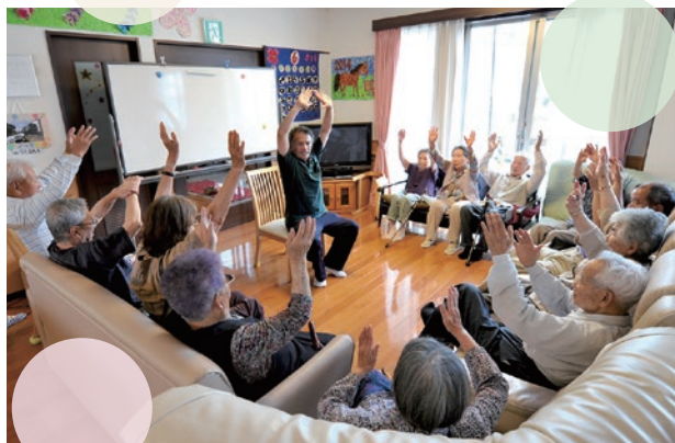
▲毎日の「レクリエーション・体操」

「通い」を中心としながら、ご利用の形態やご家族の希望に応じて、随時「泊まり」等を組み合わせてサービスを提供することで、住み慣れた地域での生活を24時間体制で支えます。