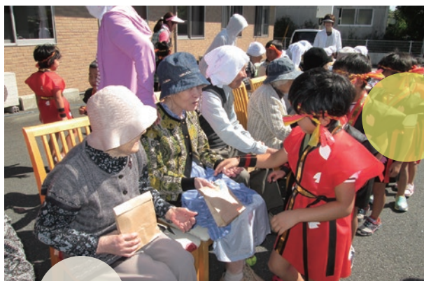
▲地元の園児による「事業所訪問」

聖峰会の専門スタッフと連携し、心身のみでなく脳活性化を図り、地域交流も行っています。