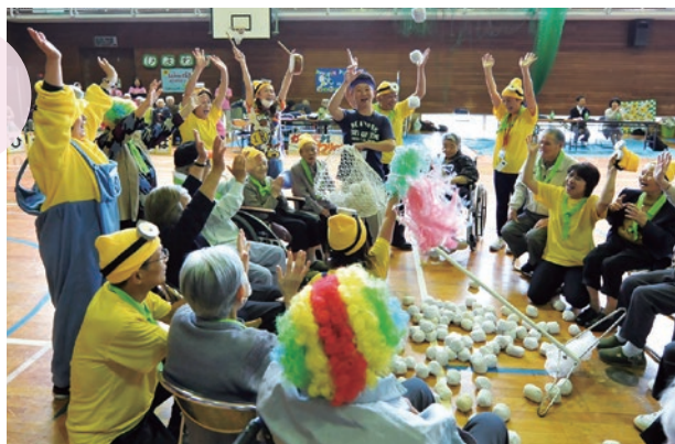
▲一致団結！「合同運動会」

「通い」を中心としながら、ご利用の形態やご家族の希望に応じて、随時「泊まり」等を組み合わせてサービスを提供することで、住み慣れた地域での生活を24時間体制で支えます。