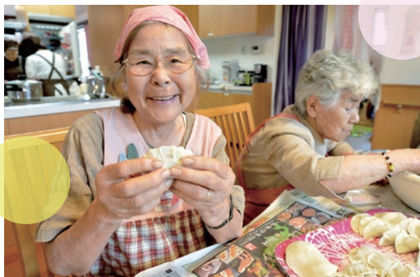
▲みんな一緒に「ぎょうざ作り」